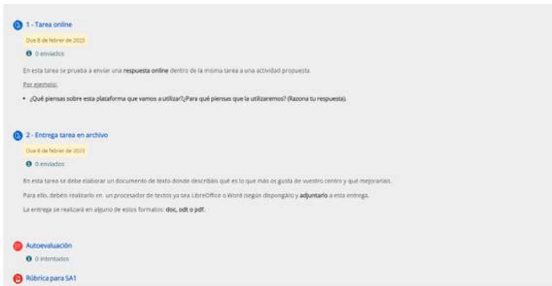
Figura 4: "Ejemplo de curso en Aules: Recursos".

Con este ejemplo, damos a conocer distintos tipos de recursos de Aules, desde archivos, cuestionarios, formatos de tareas y documentos que pueden ser utilizados por el profesorado.